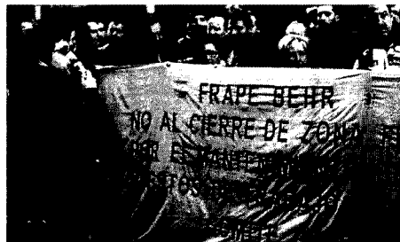
Protesta por el cierre de Frapè Behr en Barcelona.