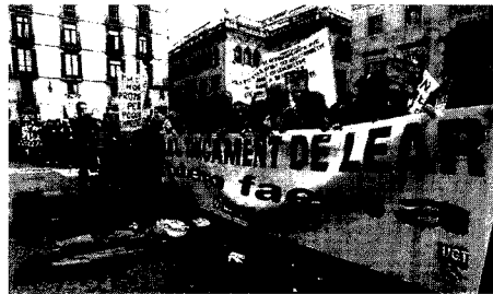
Manifestación de protesta por el cierre de Lear.

Su competidora, la nipona Yamaha, ha presentado este año un ERE temporal para 184 de los 447 empleados de su planta de Palau-solità i Plegamans (Vallès Occidental), pero ha anunciado que cerrará sus instalaciones italianas y trasladará a la fábrica catalana la producción de motocicletas de gran cilindrada.