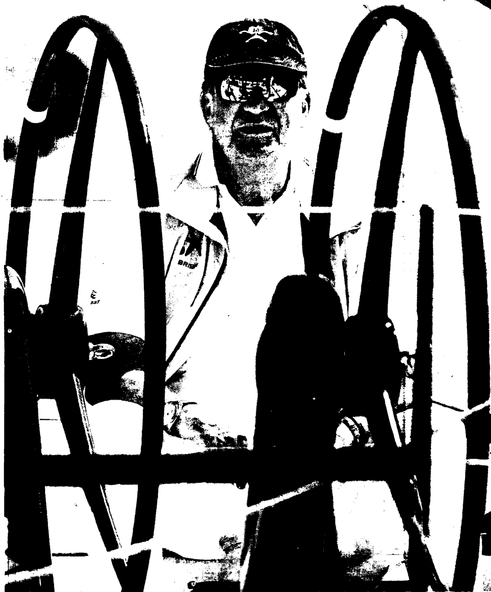
El rey, al mando del 'Bribón', durante la segunda jornada de la Regata Breitling en Mallorca, en julio de 2008.

Este año dispondrá de 8,9 millones de libre disposición // El Gobierno no prevé incluir las cuentas reales en la ley de acceso a datos oficiales