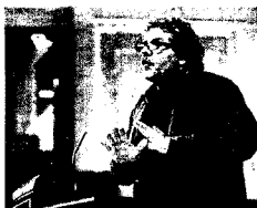
El diputado Joan Tardà.